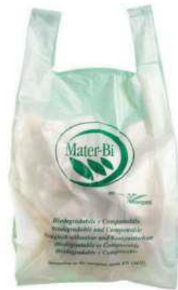
shopper in mater b