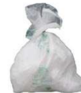
sacchetti in mater b