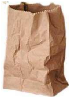
sacchetto di carta